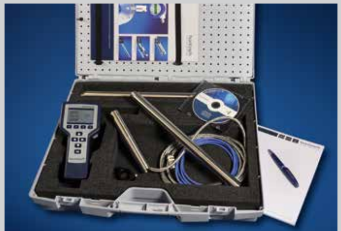
flowtherm Ex im Transportkoffer mit Sonde ZS 25 GFE 370°C