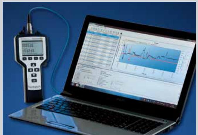
Messdatenauswertung über USB-Schnittstelle

Technische Änderungen vorbehalten. 05/15